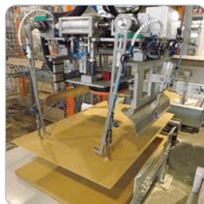
Manipulácia s preložkami