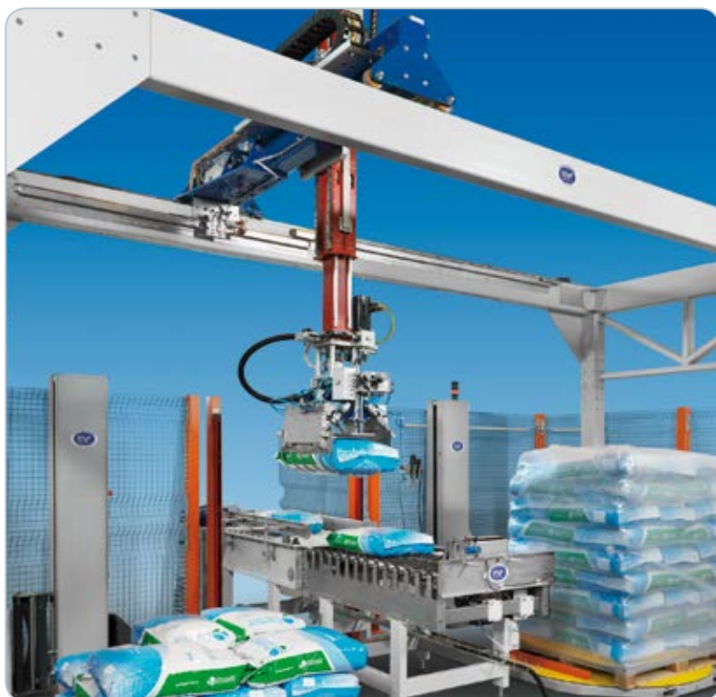
MF PCA TWIN s ovinovacími jednotkami

* Rozmery stroja MF PCA 700 sa líšia pre rôzne konfigurácie