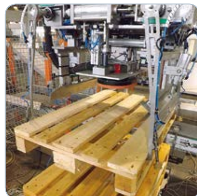
Kliešte pre manipuláciu s paletami v kombinácii s prísavným modulom.